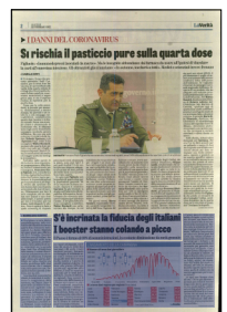
Peso: 1-4%, 2-34%

13 febbraio). Come sintetizza Fondazione Gimbe, nell'ultimo report settimanale, «crollano del 40,5% le terze dosi (946.929) e del 40,8% i nuovi vaccinati (110.791)». Entrando nel dettaglio, al 16 febbraio sono state somministrate 36.431.086 terze dosi con una media mobile a 7 giorni di 135.276 iniezioni al giorno. In base alla platea ufficiale (42.518.405), aggiornata all'11