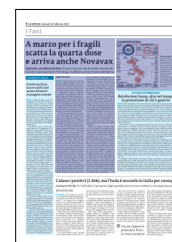
Peso: 1-4%, 6-38%

Intanto si avvicina il 31 marzo, data in cui la probabile cessazione dello stato di emergenza dovrebbe portare a progressivi cambiamenti. Figliuolo ha «dosi di vaccino stivate per ogni eventualità: poi, dopo il 31 marzo, quando passeremo la mano, ci sono tutte le interlocuzioni con il ministero per lasciare un pacchetto pronto». Marzo sarà anche il mese in cui dovrebbe maturare il confronto politico sulle future restrizioni. Il clima è caldo, parte della maggioranza preme per una de-escalation e, sebbene il presidente della Camera, Roberto Fico, abbia osservato che «un progressivo superamento delle restrizioni sia di buon senso», c'è da aspettarsi un mese di trattative serrate. Intanto, già