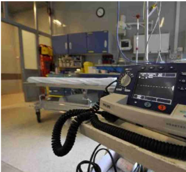
Covid - 19 Una sala di terapia intensiva vuota

nomia e Management dei Sistemi Sanitari (Altems) dell'Università Cattolica. Il dato si attestava a 3,7 decessi ogni 100.000 abitanti nella settimana dal 2 all'8 febbraio, ed è sceso a 3,0 decessi ogni 100.000 abitanti nella settimana tra il 9 e il 15 febbraio. Anche l'analisi della Fondazione Gimbe rileva il calo dei decessi, quantificato nel 16% in meno in 7 giorni. È comunque presto per abbassare la guardia, considerando che il numero dei non vaccinati o dei vaccinati solo con la prima dose non è basso, calcolato da Altems in 1.074.948 nella fascia d'età fra 50 e 59 anni.