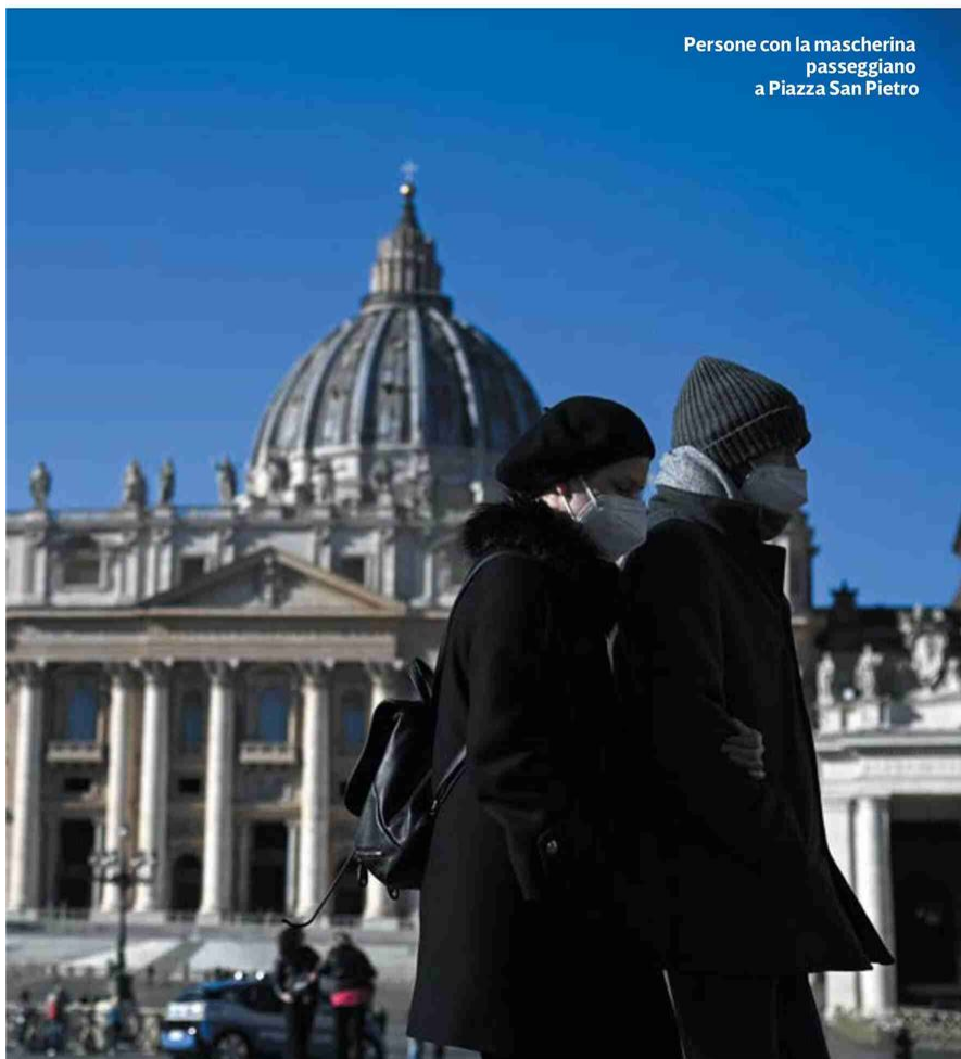
Persone con la mascherina passeggiano a Piazza San Pietro