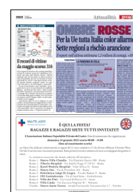
Peso: 1-5%, 3-35%