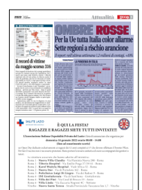
Peso: 1-5%, 3-35%

sono anche i casi attualmente positivi: sono 2.134.139 rispetto a 1.265.297 della settimana