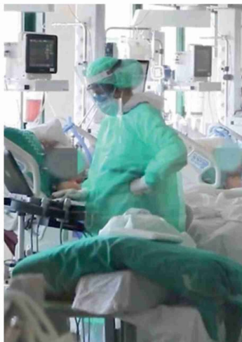
Un reparto di terapia intensiva

rassicura il sottosegretario alla Salute, Andrea Costa, è sotto controllo al momento e nessuno rischia di passare in zona gialla ma non mancano scenari di allerta. Secondo l'indice calcolato dall'Alta Scuola di Economia e Management dei Sistemi Sanitari dell'Università Cattolica, 7 le regioni e una Provincia Autonoma che presentano un quadro di rischio: Friuli-Venezia Giulia, Veneto, Val d'Aosta, Campania, Emilia-Romagna, Lazio, Liguria più la PA di Bolzano. Un andamento della curva che non è uguale per tutta Italia.