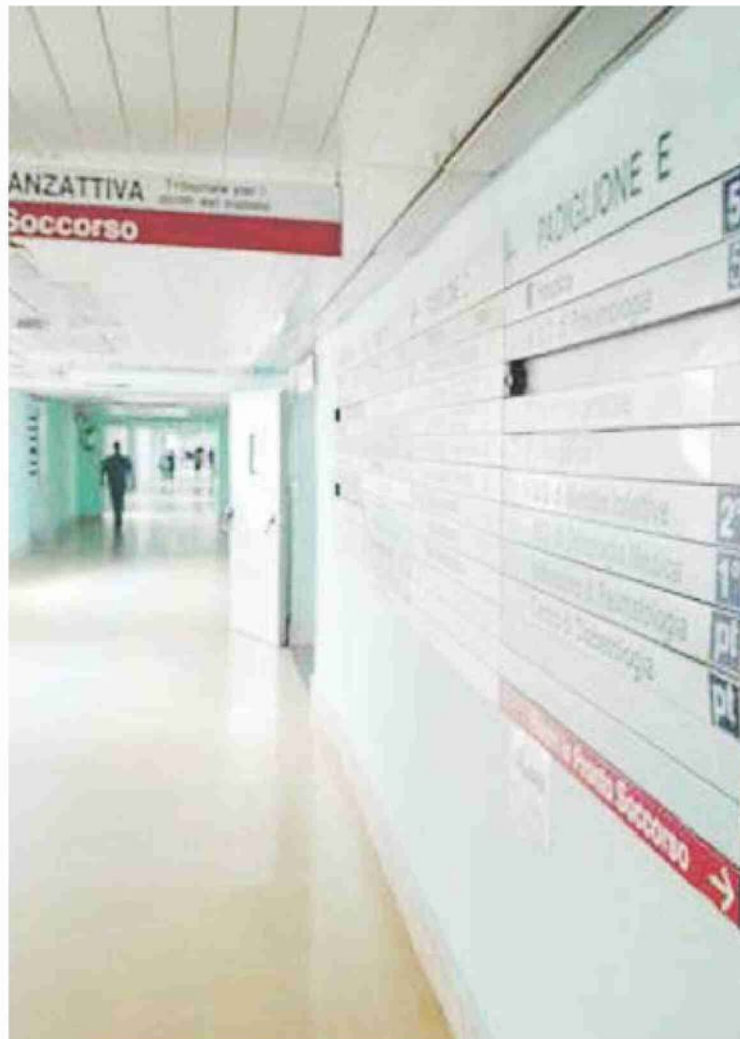
In terapia intensiva un solo ricoverato (nella foto l'ospedale San Carlo di Potenza)