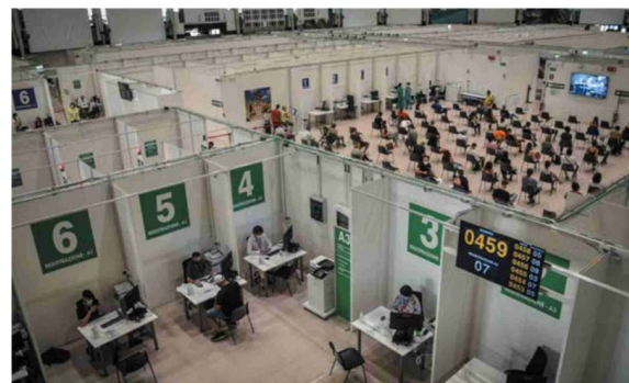
L'hub vaccinale allestito al palazzo delle Scintille di Milano e il presidente Mattarella mentre attende il proprio turno per vaccinarsi all'ospedale Spallanzani di Roma