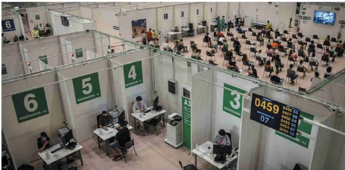
L'hub vaccinale allestito al palazzo delle Scintille di Milano