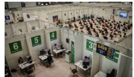
Milano L'hub vaccinale allestito al palazzo delle Scintille