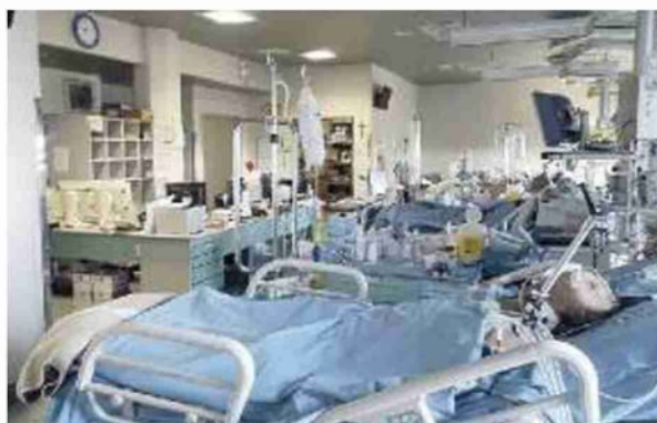
TRECENTA Due morti in poche ore nel reparto anti Covid