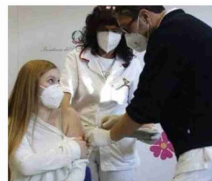
Ottimi i risultati delle somministrazioni effettuate