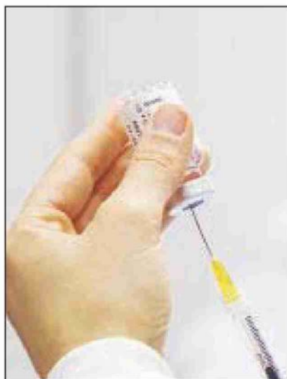
A sinistra una fiala di vaccino e a destra un operatore sanitario effettua un tampone

96% nel ridurre il rischio di morte. Percentuali che si riducono nelle persone vaccinate con dose singola rispettivamente a 70%, 81%, 89% e 80%. Oggi la campagna vaccinale, di fatto, analizza la Fondazione Gimbe , può contare solo sui vaccini a mRNA Pfizer e Moderna, visto il flop di CureVac che non ha superato i test clinici e il progressivo "tramonto" dei vaccini a vettore adenovirale: infatti, AstraZeneca viene utilizzato solo per i richiami e di Johnson & Johnson vengono somministrate poche migliaia di dosi al giorno. «In altri termini - spiega Cartabellotta - rispetto alla previsione di oltre 94 milioni di dosi per il terzo trimestre, disporremo di circa 45 milioni di dosi di vaccini a mRNA, le cui consegne al momento si attestano intorno a 2,7 milioni di dosi la settimana».