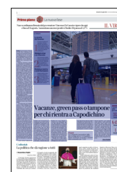
Peso: 1-3%, 4-66%