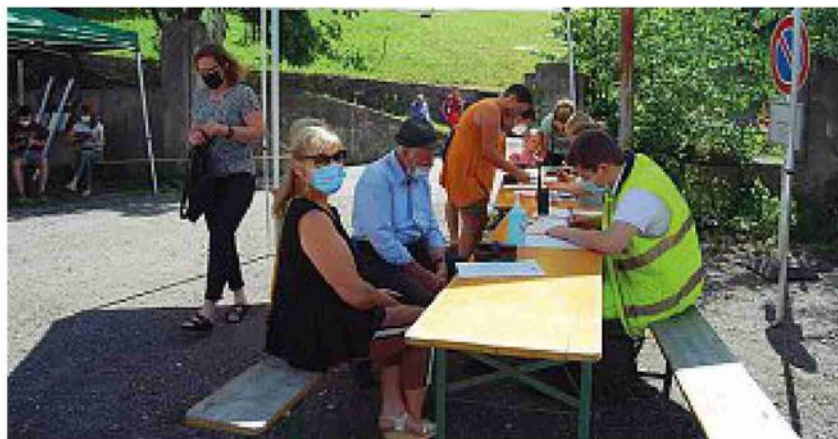
Campagna Il vax bus è partito da Moso, il Comune con la copertura vaccinale più bassa