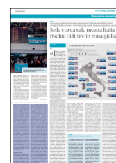
Peso: 2-42%, 3-14%