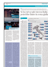
Peso: 2-43%, 3-14%