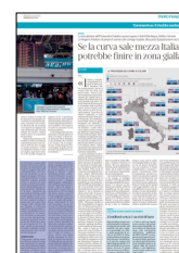
Peso: 2-22%, 3-14%