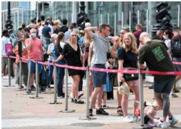
In fila per il vaccino a Londra