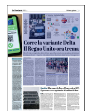
Peso: 1-1%, 5-58%