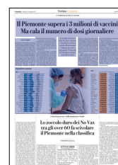
Peso: 1-14%, 7-62%