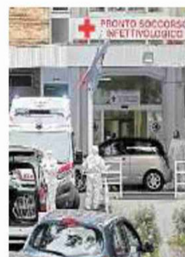
L'ospedale Cotugno di Napoli