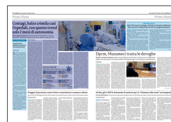
Peso: 1-1%, 2-33%

pazienti ricoverati in terapia intensiva: 62 in più per un totale di 514 (ieri erano 452), un numero che ci riporta al 26 maggio, quando nelle rianimazioni c'erano 521 pazienti ricoverati. Ed il quadro non è migliore nei reparti Covid ordinari, dove è stata superata la soglia dei 5mila ricoverati: sono 5.076, 255 più di ieri. Insomma, non è ancora emergenza ma l'allerta, soprattutto per gli ospedali, deve essere massima. Con i numeri attuali «gli ospedali italiani potranno ancora reggere almeno per 5 mesi ed al momento la situazione è gestibile, ma se dovessimo assistere ad un aumento esponenziale dei casi come sta accadendo in altri Paesi come la Francia allora il sistema ospedaliero avrebbe una tenuta di non oltre 2 mesi», afferma Carlo Palermo, il segretario del maggiore dei sindacati dei medici ospedalieri italiani, l'Anaa-Assomed. Se si passasse cioè dai circa 5mila casi di contagio giornalieri agli oltre 10mila come in Francia, rileva, «si rischia il crollo della prima trincea ospedaliera anti-Covid, perchè gli ospedali non sono pronti a far fronte ad un'epidemia e-