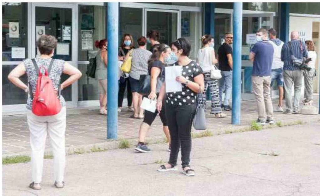
Code in attesa di poter fare il test sierologico. L'Asst è preoccupata per il super afflusso di pazienti e utenti