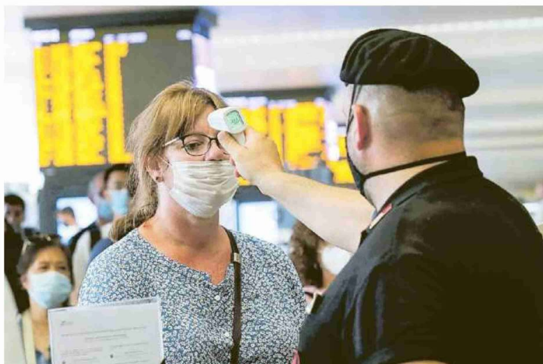
Controlli anti-Covid alla stazione ferroviaria di Roma Termini

plicano in quasi tutte le regioni. Massima attenzione a Mantova per la situazione che riguarda gli operai di un'azienda agricola dove ci sono stati quasi 100 positivi. Dal Lazio alla Toscana ci sono centinaia di cluster sotto osservazione. Uno degli ultimi è a Catania, dove c'è grande preoccupazione dopo la notizia di un giovane contagiato che aveva trascorso la serata in una discoteca in spiaggia, un locale dove si erano ritrovati centinaia di ragazzi. —