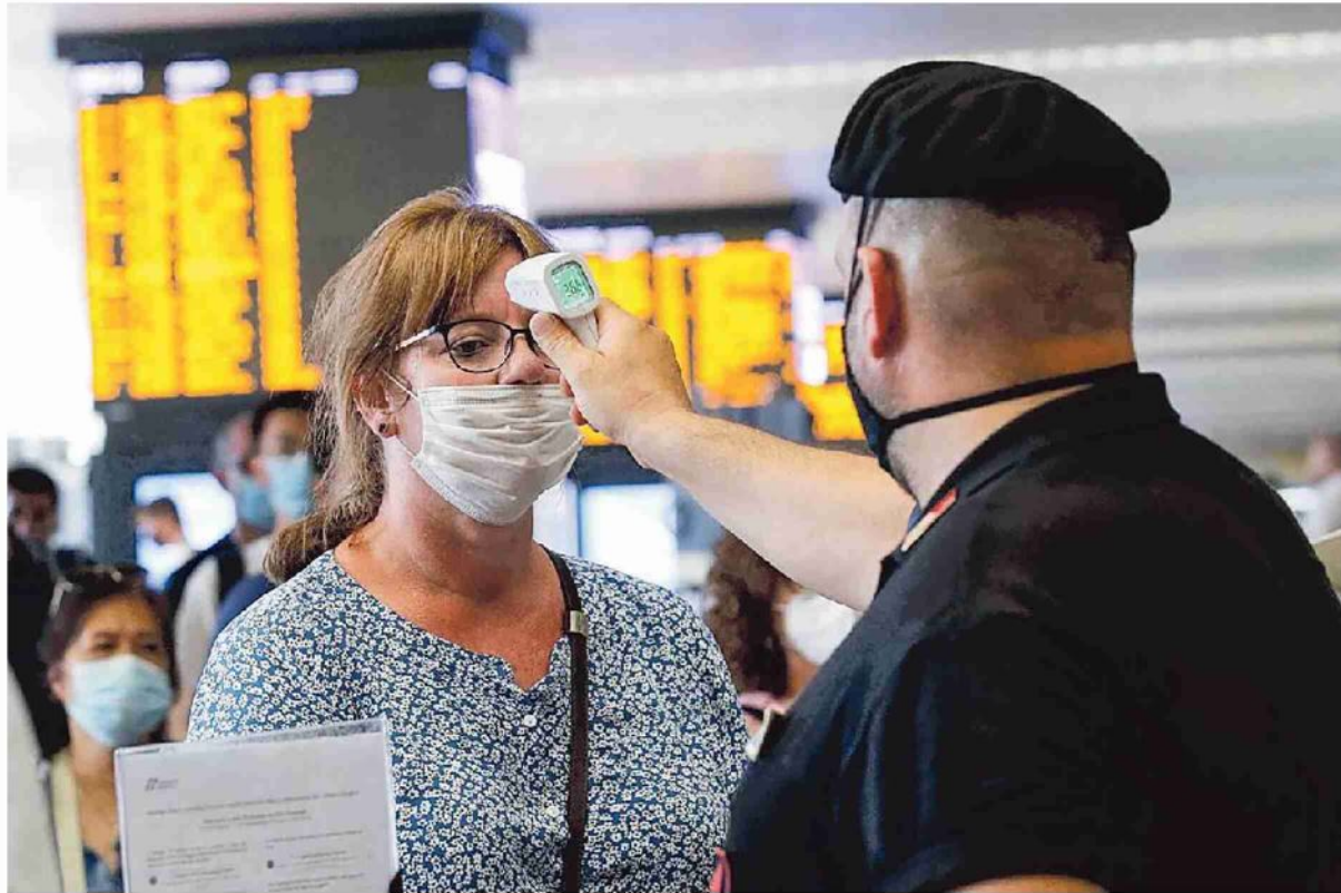
Controlli anti-Covid alla stazione ferroviaria di Roma Termini