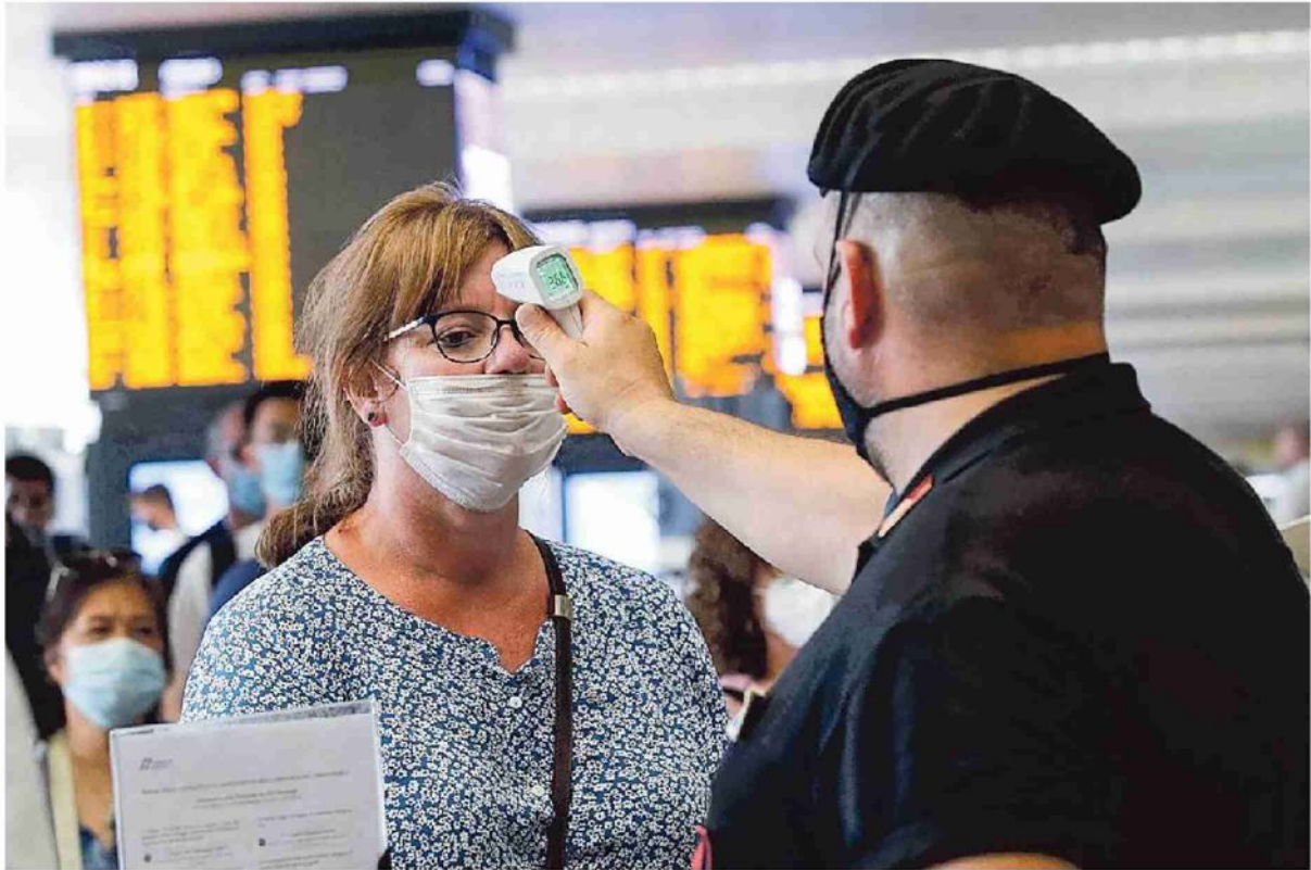
Controlli anti-Covid alla stazione ferroviaria di Roma Termini