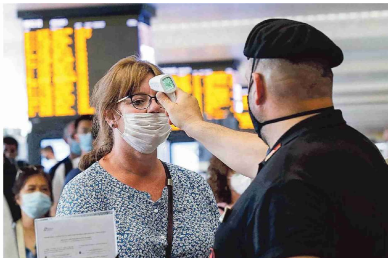
Controlli anti-Covid alla stazione ferroviaria di Roma Termini

che riguarda gli operai di un'azienda agricola dove ci sono stati quasi 100 positivi. Dal Lazio alla Toscana ci sono centinaia di cluster sotto osservazione. Uno degli ultimi è a Catania, dove c'è grande preoccupazione dopo la notizia di un giovane contagiato che aveva trascorso la serata in una discoteca in spiaggia, un locale dove si erano ritrovati centinaia di ragazzi. —