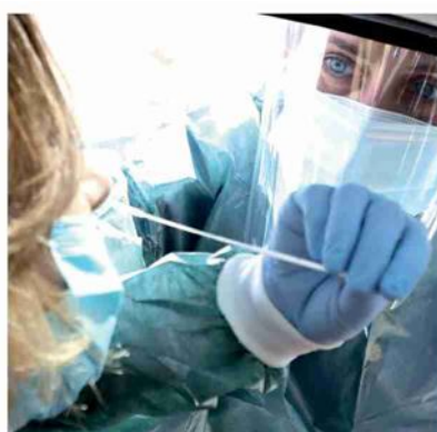
▲ Il contagio in aumento in Liguria