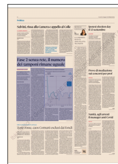
Peso: 1-3%, 12-22%