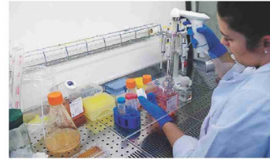
1.961 I tamponi effettuati ieri in Puglia: solo lo 0,8% positivo

nico di Bari: dopo uno screening preliminare queste persone verranno invitate a donare il proprio sangue nei centri trasfusionali, poi saranno effettuati test di ricerca degli anticorpi nei laboratori dell'Istituto zooprofilattico sperimentale di Foggia. Il plasma verrà dunque re-iniettato in pazienti con forme medio-gravi di covid, per verificare se questo approccio è effettivamente in grado di produrre benefici sulla salute. [m.s.]