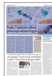
Peso: 1-20%, 5-57%

In Puglia, a fronte di 103 casi di positività ogni 100mila abitanti (la