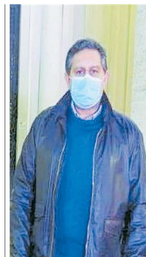
▲ Giovanni Toti

numero di nuovi casi che dimostra come non si sia raggiunta quella prolungata stabilizzazione propedeutica alla ripartenza». Una possibilità che lo stesso Toti minimizza («ragiona sui dati dei tamponi, che noi andiamo a fare nei luoghi più a rischio contagi, quando l'unico, vero indicatore utile sono i posti letto: la diffusione sta flettendo»), ma su cui insistono le opposizioni in Regione. «È la fotografia di un fallimento, - attacca il Pd - Cosa pensa di fare Toti, visto che ogni errore in questa fase rischia di farci riprecipitare nella pandemia?».