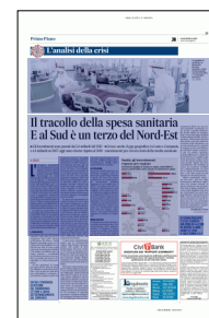
Peso: 1-4%, 13-66%

I valori sono straordinariamente alti in Trentino-Alto Adige e Valle d'Aosta; molto superiori alla media in Emilia-Romagna, Toscana e Vene-