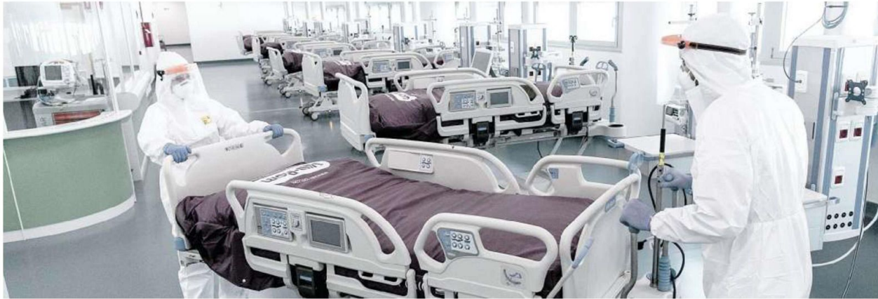
L'ospedale di Verduno, in Piemonte, diventa operativo come Covid hospital, con 50 posti letto e 7 di terapia intensiva