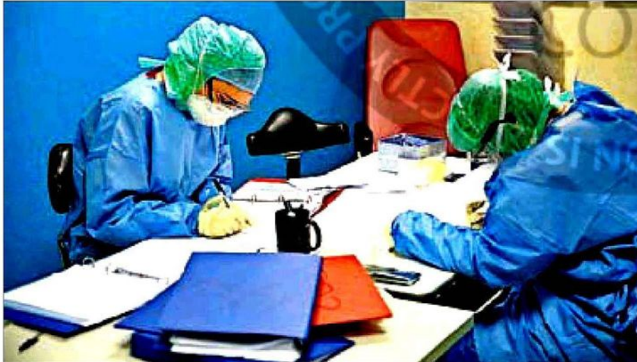
Personal de una UCI, ayer en un hospital milanés.