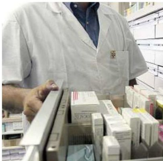
Gli italiani preferiscono i farmaci di marca