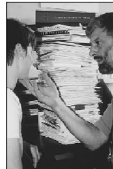
Pile of 855 guidelines in general practices in the Cambridge and Hertfordshire Health Authority