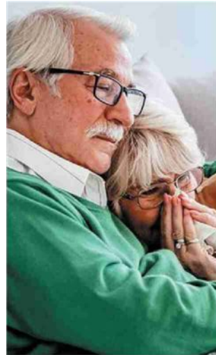
Nelle foto a destra, una coppia di anziani alle prese con l'influenza e la preparazione di un vaccino

L'Asl di Pescara ha il primato dei vaccini Covid, Chieti quello dell'influenza