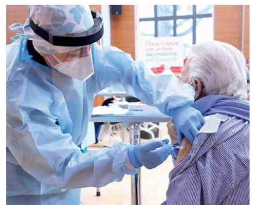
Un anziano si sottopone alla vaccinazione anti-Covid

ELABORAZIONE GIMBE SU DATI MINISTERO DELLA SALUTE DATA ULTIMO AGGIORNAMENTO DATI: 28 DICEMBRE 2023 DATA ULTIMO AGGIORNAMENTO PLATEA: 17 FEBBRAIO 2023