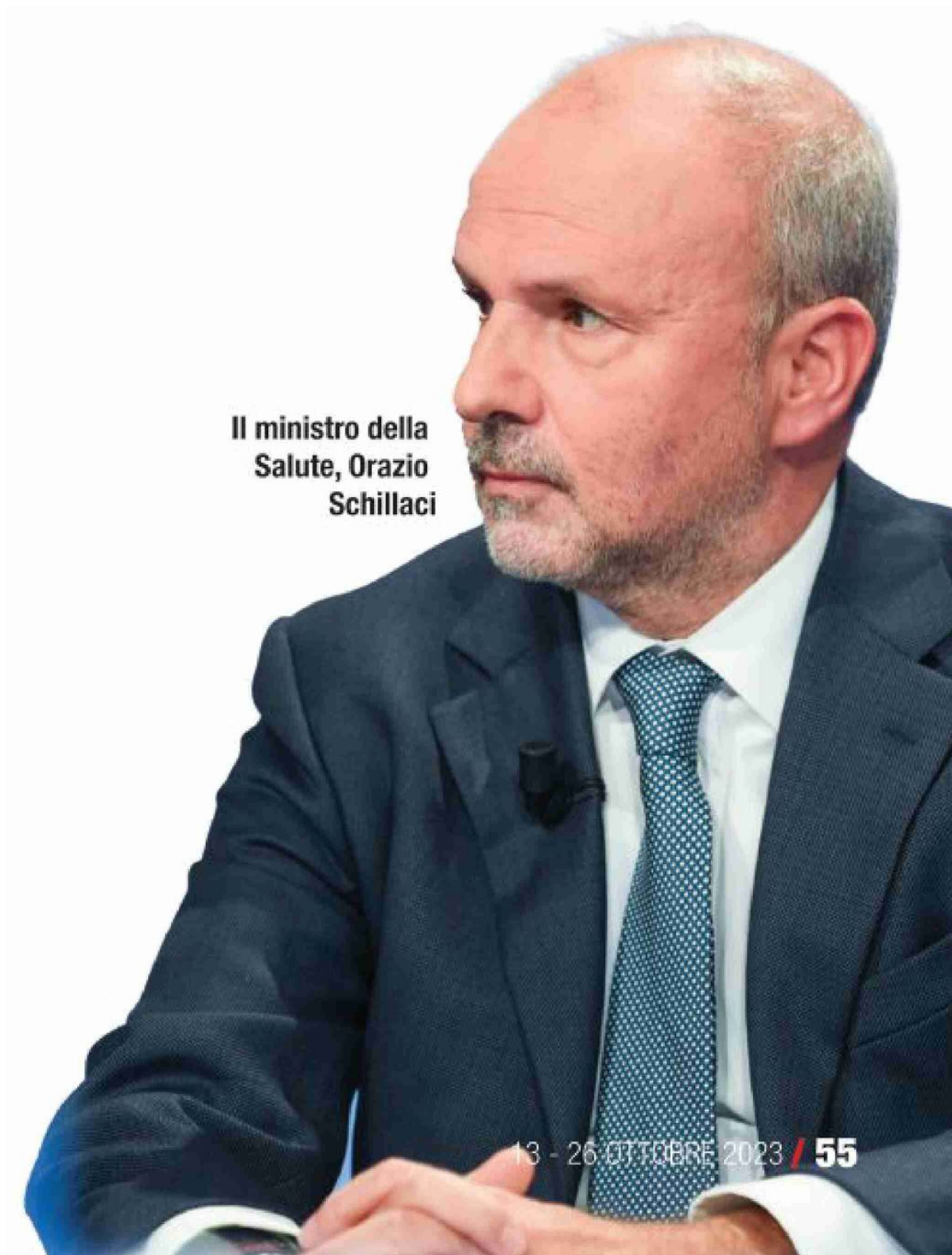
Il ministro della Salute, Orazio Schillaci