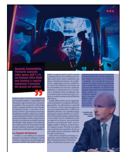
Peso: 54-84%, 55-100%

Il rapporto spesa sanitaria/Pil del 6,7 per cento del 2022 scende al 6,6 per cento nel 2023 e continuerà a calare negli