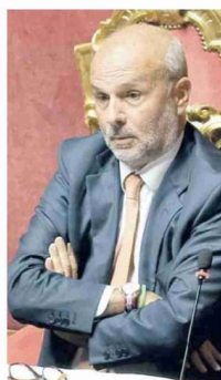
Il ministro della Salute Orazio Schillaci ha annunciato l'arrivo dei nuovi vaccini contro il Covid per la prossima settimana