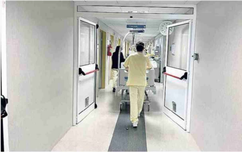
La sanità in apnea dopo lo tsunami Covid