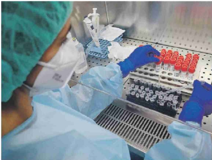
Siamo nella settimana numero 126 dall'inizio della pandemia in Ciociaria

* l'elevato numero odierno dei guariti è dovuto a una cifra risultante da un lavoro di riallineamento dati delle settimane pregresse