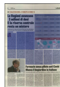
Peso: 1-2%, 4-62%

quelle mantenute a livello centrale, una prima risposta a un'eventuale allargamento della platea della quarta dose». Quarta dose, fin qui riservata solo ai soggetti immunocompromessi, che però procede al rallentatore: secondo i dati della Fondazione Gimbe diffusi ieri, l'hanno ricevuta solo circa 383.000 persone, con ampie disegualanze regionali. Stessa musica per il terzo shot: restano scoperti quasi 2,7 milioni di persone che possono riceverlo subito, pari al 5,6% della platea, mentre 5,65 milioni di italiani devono aspettare in quanto guariti da meno di 120 giorni.