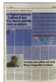
Peso: 1-2%, 4-62%

manca una certa trasparenza sul prezzo delle dosi dei vaccini anti Covid perché i contratti sono protetti da clausole di riservatezza. Le elaborazioni dell'Osservatorio Cpi sui dati Anac e Openpolis rivelano comunque due aree di prezzo: una, compresa tra 1,79 e 4,21 euro a dose, relativa ai contratti conclusi nel primo semestre dello scorso anno e legati presumibilmente al vaccino Astrazeneca; e un'altra, tra 14,37 e 22,82 euro, per i contratti stipulati tra dicembre 2020 e aprile 2021 (probabilmente relativa ai vaccini Pfizer e Moderna).