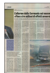
Peso: 1-3%, 14-40%, 15-3%

Persino Nino Cartabellotta , presidente della Fondazione Gimbe , è lapidario: «Ad oggi per la popolazione generale non ci sono evidenze scientifiche che dicano: serve la quarta dose». E non si sottrae nemmeno un'altra celebrità del calibro di Massimo Galli : «Non ha senso. Non è di