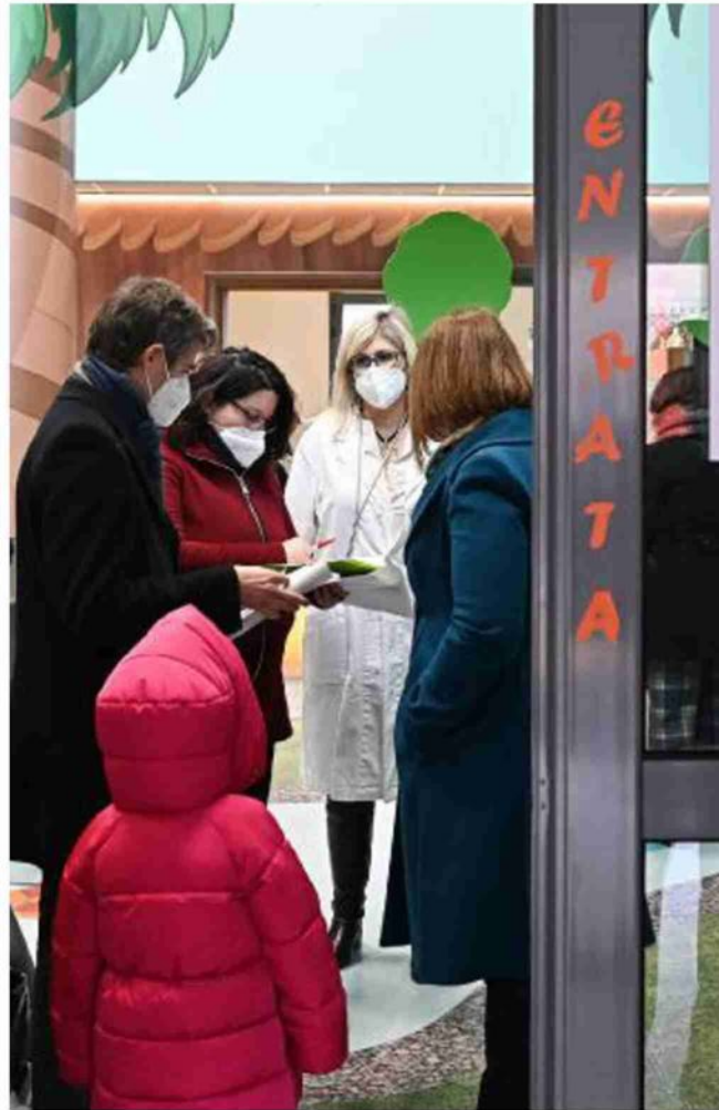
Torino L'hub vaccinale dedicato ai bambini