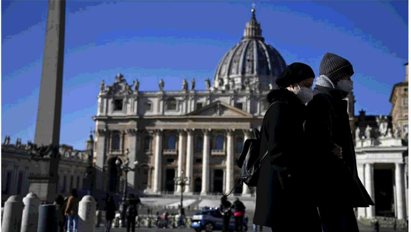
Roma Persone con la mascherina passeggiano a Piazza San Pietro