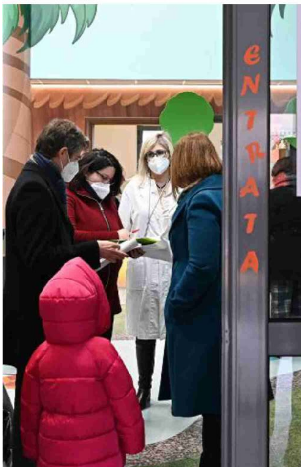
Torino L'hub vaccinale dedicato ai bambini