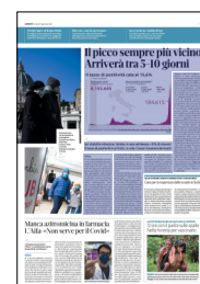
Peso: 1-1%, 3-36%