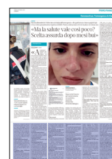
Peso: 2-23%, 3-26%