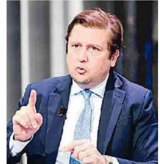
PIERPAOLO SILERI SOTTOSEGRETARIO ALLA SALUTE