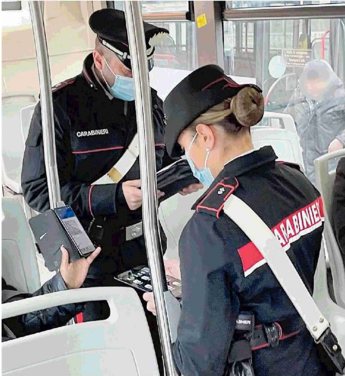
Un controllo sul bus: in Italia scaricati 186 milioni di Green Pass