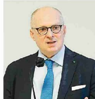
WALTER RICCIARDI CONSULENTE DEL MINISTERO DELLA SALUTE