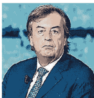
ROBERTO BURIONI VIROLOGO E IMMUNOLOGO