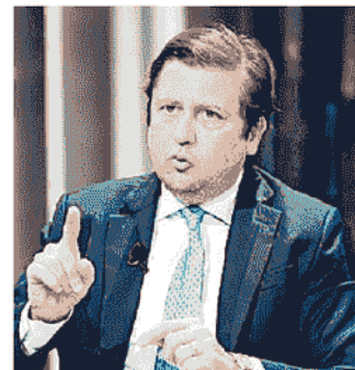
PIERPAOLO SILERI SOTTOSEGRETARIO ALLA SALUTE

Una multa pari a due divieti di sosta rende l’obbligo una buffonata