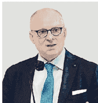
WALTER RICCIARDI CONSULENTE DEL MINISTERO DELLA SALUTE