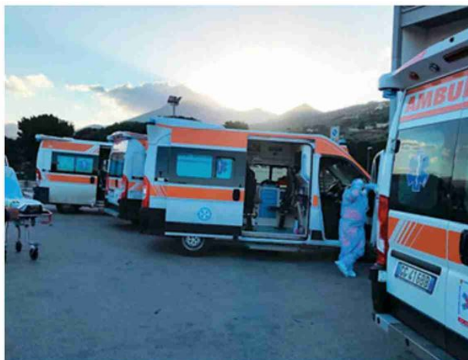
L'ospedale da campo allestito al Cervello di Palermo

Non rassicurano neanche le previsioni del matematico del Cnr Giovanni Sebastiani: «Se continuasse questo trend, entro 40 giorni supereremmo a livello nazionale il 30% di occupazione nelle intensive ed entro un mese il 40% nei reparti, mentre per l'incidenza nazionale siamo già a 1.640 casi su 100mila abitanti: questo significa che i tre parametri per l'ingresso in zona rossa sarebbero superati a livello nazionale in 30-40 giorni, ma - afferma - ci potrebbero essere differenze tra le singole Regioni». Intanto, conclude Sebastiani, già domani altre 4 Regioni potrebbero passare in gialla (Abruzzo, Emilia-Romagna, Valle d'Aosta e Toscana) e la Liguria in arancione.